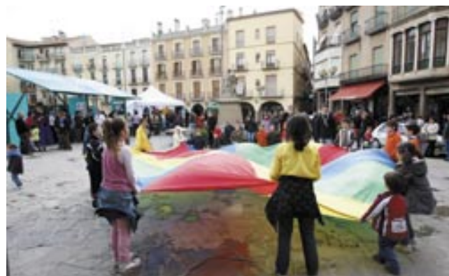
L'Agrupació Escolta Hug Folc, les Bruixes de Cardona i l'Associació Cultural 18 de Setembre van organitzar diverses activitats infantils

Els actes es van reprendre a partir de les 4 de la tarda després de la intensa pluja que va caure al migdia i que, sortosament, no va obligar a modificar la programació i els horaris previstos.