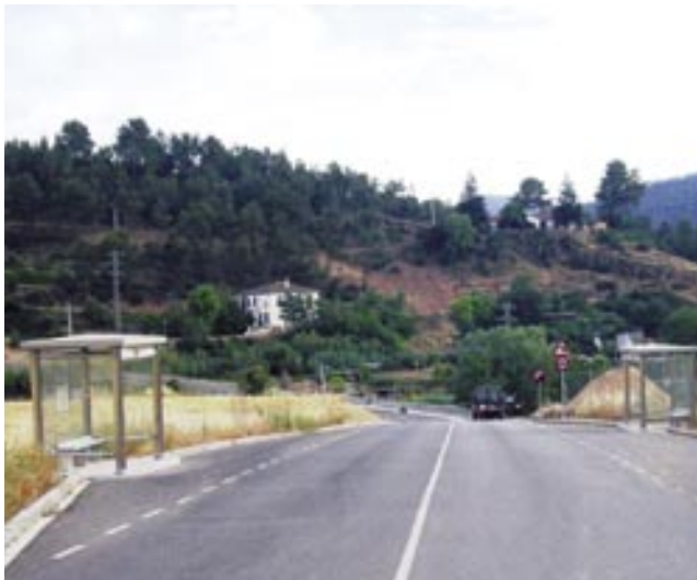
Imatge de les dues marquesines instal·lades a la Coromina