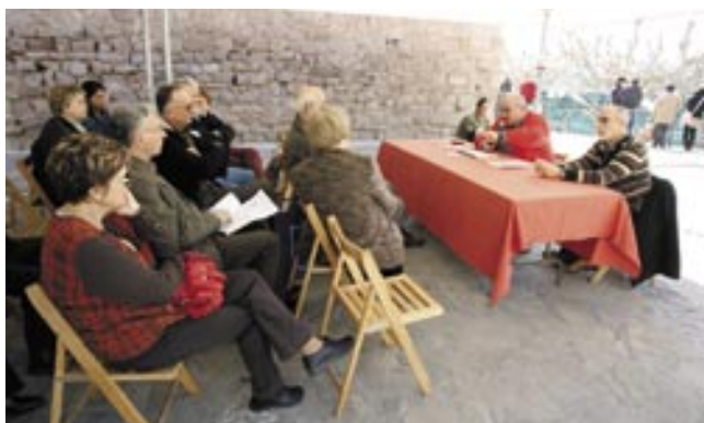
Les associacions de veïns van organitzar una xerrada sobre transport públic