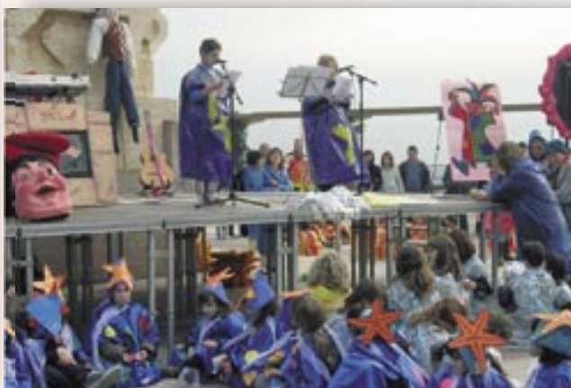
El Carnaval infantil