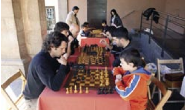
El Foment Cardoní va organitzar una torneig d'escacs