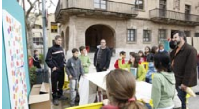
La Unió de Botiguers i Comerciants de Cardona també participar a la Fira