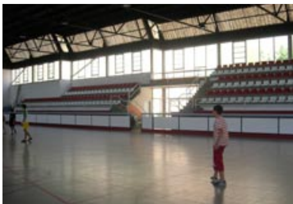
Imatge dels nous seients instal·lats a les grades del pavelló municipal

A més, també s'ha instal·lat una doble porta a l'entrada principal del pavelló per tal de millorar la climatització de l'edifici i minimitzar la despesa energètica per fer funcionar l'equipament.