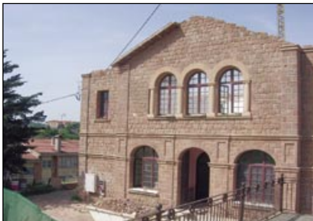
Obres de rehabilitació de les antigues escoles Escasany