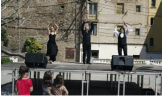
La Casa d'Andalusia va oferir una exhibició de sevillanes