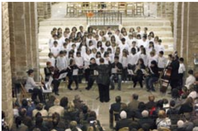
Imatges de la Trobada de Corals del Bages celebrada a Cardona i de la Flautada de la Catalunya Central celebrada a Vacarisses

L'orquestra que va acompanyar els cantaires estava for-