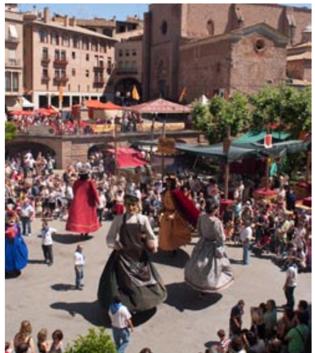
Els gegants de Cardona també van participar a la festa