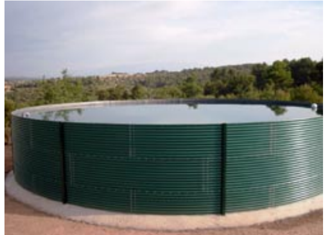
El nou dipòsit antiincendis s'ha instal·lat prop de la carretera del Miracle

El projecte ha suposat una inversió de 20.148 euros i ha permès construir un vas de 12,6 metres de diàmetre i 2,5 metres d'alçada amb una capacitat per emmagatzemar 315 metres cúbics d'aigua. Les obres s'han executat en dos mesos per tal que fos operatiu aquest estiu.