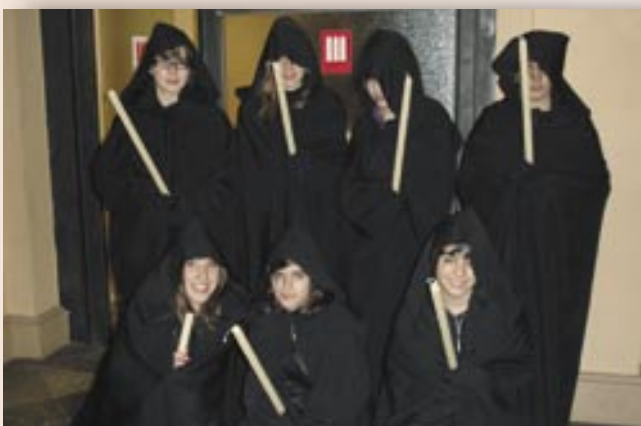
Les ploraneres de dimecres de cendra