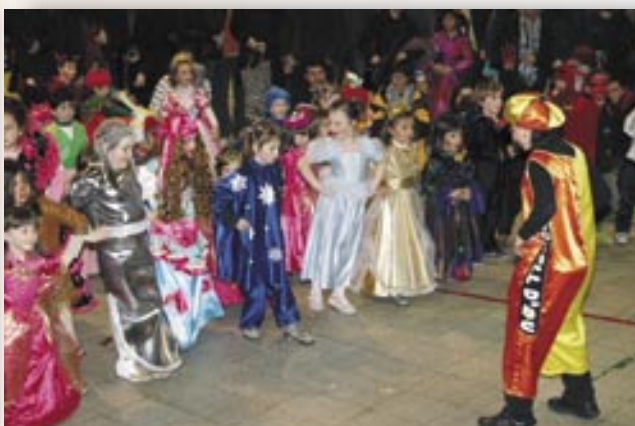
El ball de disfresses va ser molt animat