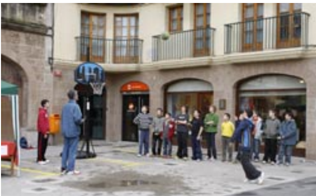
Els més joves van gaudir de les activitats del Club Bàsquet Cardona