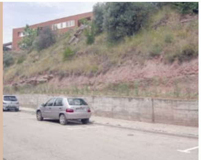
Els treballs han permès millorar l'aspecte de la zona

A més, l'Ajuntament ha completat les actuacions per millorar la imatge d'aquesta zona amb el repintat de la senyalització de les places d'estacionament del carrer Ramon de Puig i de Molins.