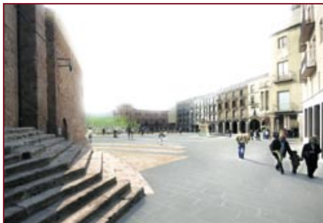
Imatge de la proposta de remodelació de la Fira de dalt

L'Ajuntament ha convocat un procés de participació per tal de recollir els suggeriments i propostes en relació amb el plantejament tècnic presentat per l'equip guanyador.