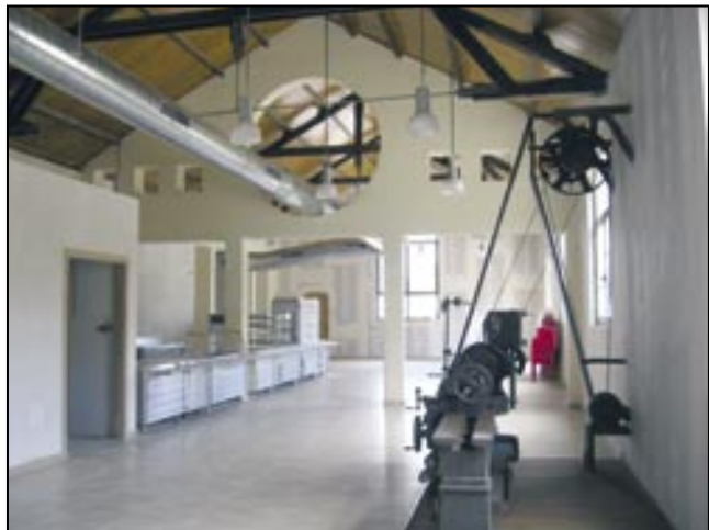
El Parc Cultural de la Muntanya de Sal disposarà d'una nova cafeteria i un nou espai de recepció per als visitants

En l'actualitat s'estan executant les obres de la cafeteria-botiga que s'ha ubicat a la zona central de l'antiga mina Nieves. Aquesta actuació compta amb el suport de la Direcció General de Turisme de la Generalitat i el pressupost de les obres ascendeix a 274.017 euros. La