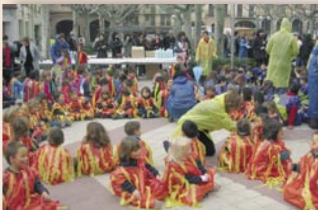
Els més petits també es disfresen per Carnaval