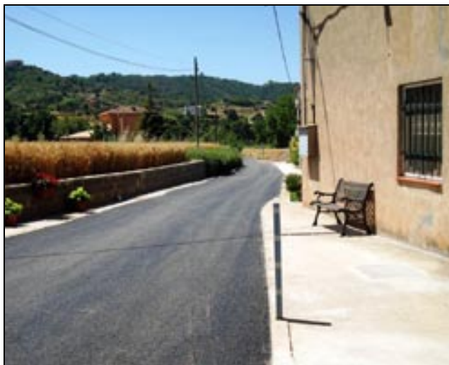
Un dels camins que s'han pavimentat recentment

A banda de millorar els accessos a les diverses masies de la zona, les obres permetran incrementar la seguretat i millorar el trànsit als camins rurals del municipi. Amb l'adequació d'aquests vials de titularitat municipal, Ajuntament i veïns s'estalviaran els costos que any rera any suposava el manteniment dels camins de la zona rural de Cardona que té en l'actualitat més d'un centenar de masies habitades.