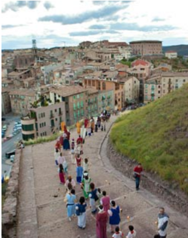
El Senyor i la Minyona sortint del Castell en comitiva fins al centre històric