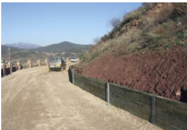
S'ha adequat tot l'aparcament i s'ha reforçat el mur de contenció del talús

L'Ajuntament de Cardona ha actuat sobre l'aparcament de les Torretes, situat a la cornisa de l'avinguda del Ras-trillo, per tal de millorar l'espai, la seguretat i l'entorn de la zona. Les actuacions han consistit a repassar la base del talús de la muntanya i la instal·lació d'un petit mur de contenció. Les obres han tingut un cost de 18.000 euros i han servit també per ordenar les places d'estacionament existents a la zona. L'aparcament disposa actualment d'un total de 26 places, la majoria de les quals en semi bateria i una altra part, en fila. A la zona central i al final de l'aparcament s'han deixat dos espais lliures per tal de facilitar les maniobres dels vehicles.