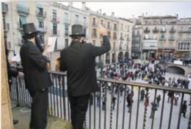
El Carnestoltes pronunciant el sermó