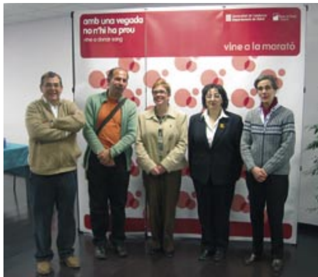
Els impulsors de la Marató amb l'alcalde i la regidora de Serveis Socials de l'Ajuntament

L'Agrupament Escolta Hug Folc, la Fundació Cardona Històrica, els Geganters i els Grallers de Cardona, l'escola de música Musicant, el grup de percussió Vas-Tukada, l'Associació Cultural 18 de setembre, l'associació de gent gran "La Sal de Cardona". També hi van col·laborar la Pastisseria Montserrat i Flequers de Cardona.