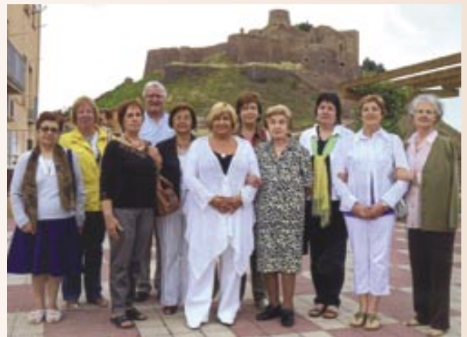
Els membres de la Junta actual de Mans Unides Cardona

Per celebrar el desè aniversari, Mans Unides de Cardona organitzarà un recital amb l'actuació de la Coral Estel de Gironella. Serà el 5 de setembre a dos quarts de 10 del vespre, al teatre Els Catòlics. La Coral Estel interpretarà