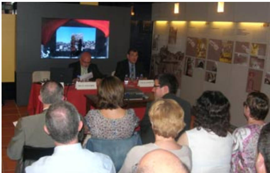
La presentació de la Ruta Pirineu Comtal va omplir de gom a gom el Centre Cardona Medieval

La Ruta Pirineu Comtal recorre els territoris de 14 comarques, i 11 dels antics comtats que van ser escenari de la configuració i naixement de Catalunya. La Ruta pretén identificar i crear grans rutes nacionals a partir del patrimoni cultural, natural i històric i a la Catalunya Central