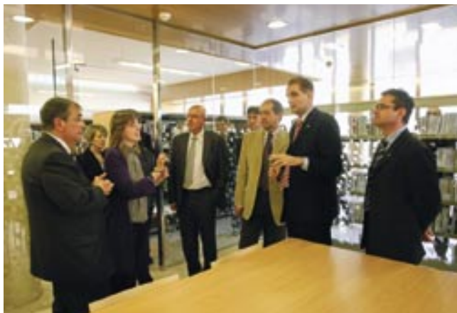
Visitant l'interior de l'edifici