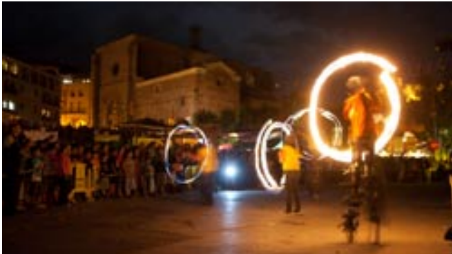
L'espectacle "Somnis" de Bruixes de Cardona va captivar el públic assistent