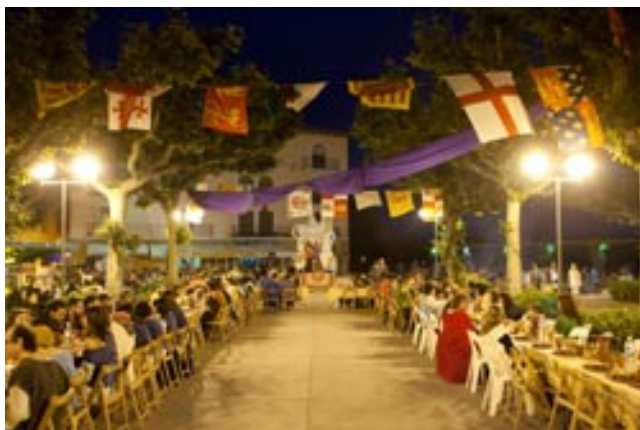
El sopar medieval continua sent un dels principals atractius de la Fira