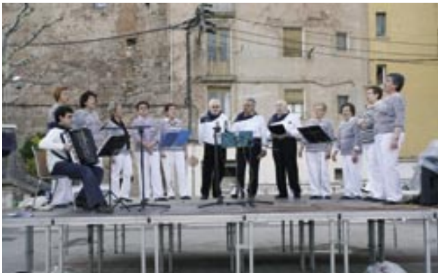
Havaneres amb la Sal de Cardona