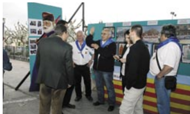
Els Geganters de Cardona van fer ballar els gegants a la Fira