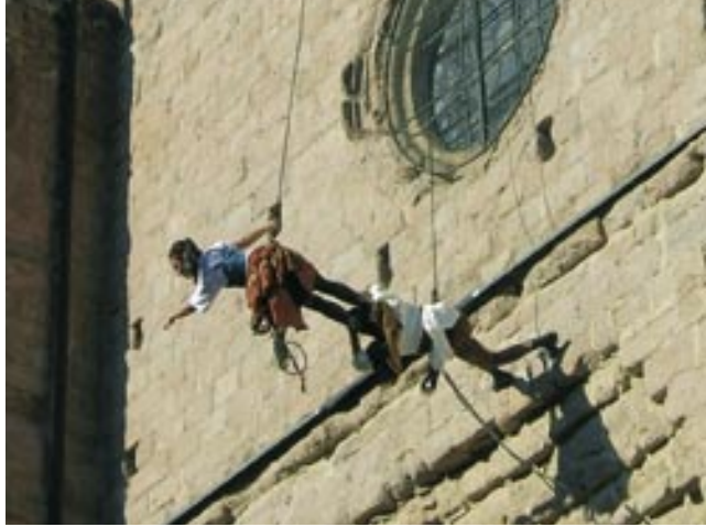
El grup "Del Revés" va protagonitzar l'espectacle més sorprenent de la passada edició de la Fira Medieval

gar gairebé 200 comensals vestits amb la indumentària pròpia de l'època. Acabat el sopar les Bruixes de Cardona van oferir el seu nou espectacle "Somnis" que va ser molt aplaudit. Un concert del grup Strombers va posar el punt i final a la jornada de dissabte amb la plaça de la Fira plena de gent. La Fira Medieval va comptar en aquesta edició amb una mostra de cavalls i un gran nombre d'activitats per als més petits com tallers de sal, titelles infantils, ballades de gegants o gimcanes. Diumenge a la tarda es va celebrar l'acte simbòlic de lliurament de la moneda de pagament del Dret d'Aimines. L'Ajuntament ha volgut agrair la col·laboració de totes les persones i entitats que van participar en l'organització de la Fira.