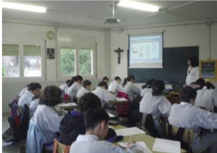
Una de les aules del CEIP en què s'apliquen les noves tecnologies per l'ensenyament i la formació de l'alumnat

Per tirar endavant el projecte, l'escola va incorporar canons de vídeo a les aules i va connectar a internet els equips informàtics. Posteriorment, cada alumne obtenia una llicència i un "password" per tal de poder accedir on-line als continguts acadèmics. Els llibres de text digital ofereixen un suport gràfic, que facilita la comprensió dels