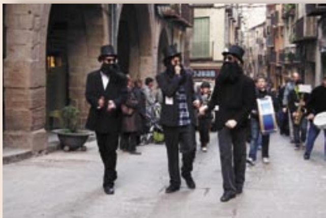
El Carnestoltes i la seva comitiva pels carrers de la vila