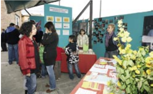
Les AMPA's de Cardona també van ser presents a la Fira