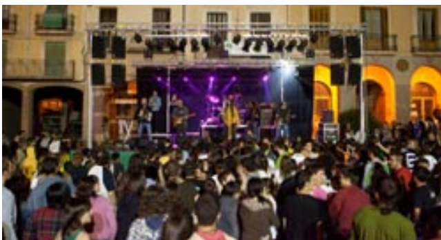
Strombers va posar la nota musical i més festiva a la Fira Medieval