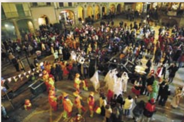
La cursa d'andròmines va omplir de festa la plaça de la Fira