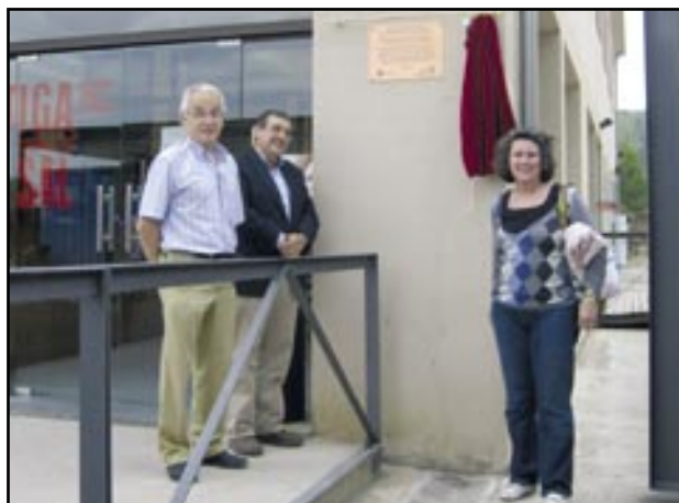
L'alcalde de Cardona i els representants del Museu de la Ciència i la Tècnica de Catalunya després de descobrir la placa acreditativa

El patrimoni industrial de Cardona -lligat a l'explotació de la sal i la potassa- comparteix reconeixement amb altres elements del passat industrial de la Catalunya