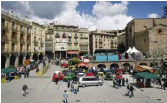
Els Amics del Motor de Cardona van omplir la Fira de vehicles clàssics