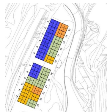
INTERVENCIÓ COLÒNIA MANUELA

En el cas de la colònia Manuela, dels 8 habitatges en ús, 6 estan en bon estat o presenten patologies lleus.