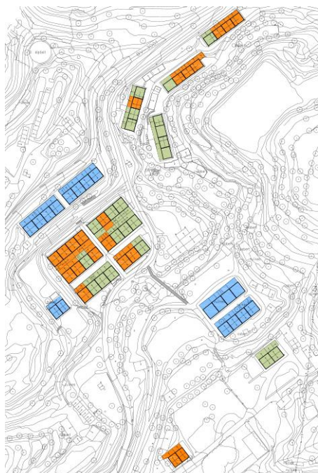
INTERVENCIÓ COLÒNIA ARQUERS

Els habitatges en ús presenten condicions adequades. Molts dels habitatges sense ús es troben en mal estat.