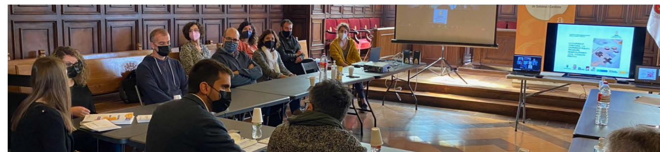
Presentació del Consell de la Formació Professional del Solsonès i Cardona

Des de l'Agència de Desenvolupament Local es treballa la formació professional com a eix estratègic per millorar tant la qualificació i l'ocupació de la població com la competitivitat de les empreses, amb la finalitat d'afavorir la permanència al territori de l'activitat econòmica i les persones, i la qualitat de vida. El disseny conjunt de l'oferta d'FP per part d'agents educatius, econòmics i socials ha de permetre reduir el desajust existent en el mercat de treball.