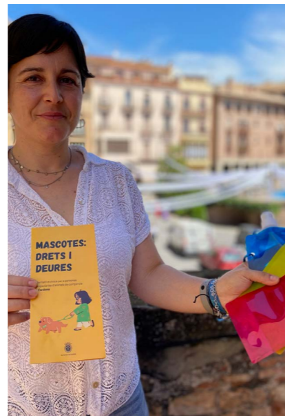
La regidora de Medi Ambient presentant les ampolles plegables

La iniciativa respon a la voluntat de la Regidoria de Medi Ambient d'incentivar una tinença responsable dels gossos a la via i als espais públics i fomentar el civisme ciutadà.