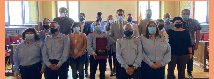
Entrega del Saler d'Or a l'Associació de Voluntaris de Protecció Civil de Cardona

L'Ajuntament de Cardona ha atorgat el Saler d'Or de la vila de Cardona 2021 a l'Associació de Voluntaris de Protecció Civil de Cardona.