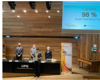
Entrega del premi InfoParticipa 2020