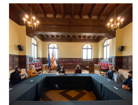
Trobadra amb el Departament de Cultura