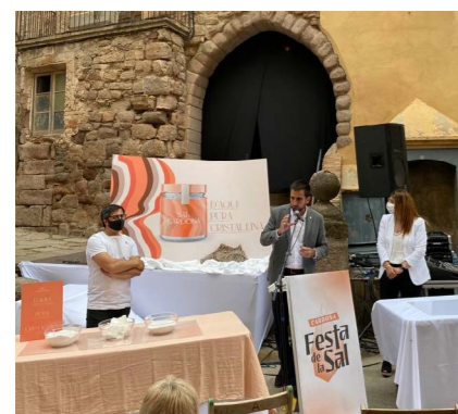
Presentació de La Sal de Cardona

El mes de juliol continuarà amb un parell de propostes. Per una banda, diumenge 11 de juliol a les 19 h, a la Fira de baix, i per primer cop amb un espectacle familiar, La bona vida, a càrrec del grup 2princesesbarbudes . Per altra banda, el divendres 16 de juliol, i en el marc de la setmana de la poesia, el grup Rumbesia portarà el seu espectacle de poesia i música a la plaça de la Biblioteca a les 19 hores.