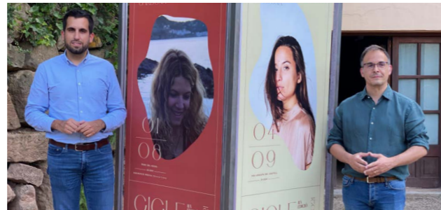
Acte de presentació del Cicle Espais 2021

El projecte arriba després del treball conjunt de l'Ajuntament de Cardona, la Fundació Cardona Històrica, l'Agència de Desenvolupament Local i l'empresa Salinera de Cardona, que aquesta última en serà el proveïdor.