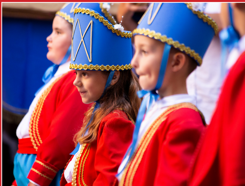
2n PREMI: 'A PUNT DE BALLAR', de Ramon Colell

EDICIÓ: Ajuntament de Cardona, plaça de la Fira, 1. Tel. 93 869 10 00, Fax 93 868 29 01, cardona@cardona.cat. COORDINACIÓ, REDACCIÓ I MAQUETACIÓ: Carmina Oliveras Vila. DISSENY: Erika Escudero Doncel. CORRECCIÓ ORTOGRÀFICA: Maria Patrocini Sala i Semís. IMPRESSIÓ: Gràfiques del Cardener SL.