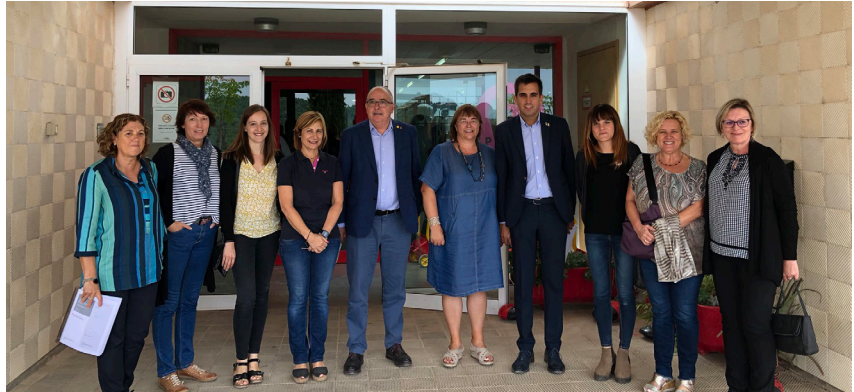
El conseller, l'alcalde, autoritats i l'equip directiu a l'escola Mare de Déu del Patrocini

En la seva visita al Patrocini, el conseller va conèixer sobre el terreny el projecte per dotar el centre escolar d'un nou accés per a vianants a través del carrer Ramon Puig i Molins. Es tracta d'una obra important per a Cardona que el departament està tirant endavant amb un pressupost de 322.128,26 euros.