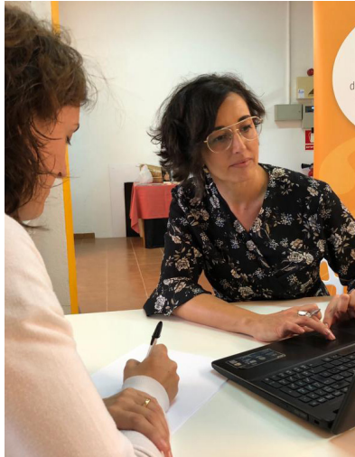
S'hi destinen un total de 15.000 euros

Les subvencions concedides s'hauran de destinar a finançar projectes o activitats