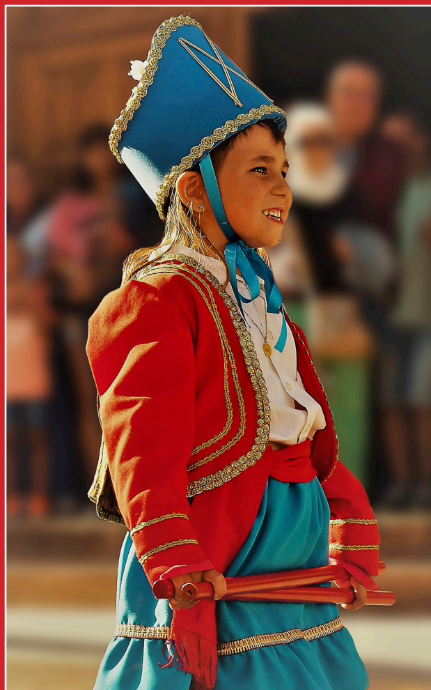
3r PREMI: 'FENT HISTÒRIA', de Jordi Fàbrega

EDICIÓ: Ajuntament de Cardona, plaça de la Fira, 1. Tel. 93 869 10 00, Fax 93 868 29 01, cardona@cardona.cat. COORDINACIÓ, REDACCIÓ I MAQUETACIÓ: Carmina Oliveras Vila. DISSENY: Erika Escudero Doncel. CORRECCIÓ ORTOGRÀFICA: Maria Patrocini Sala i Semís. FOTOGRAFIES: Marçal Llimona Creixell, Carmina Oliveras Vila, Fotografia Boixadera. IMPRESSIÓ: Gràfiques del Cardener SL.