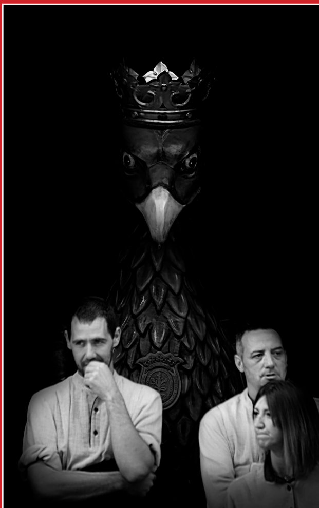
1r PREMI: 'TOTS A PUNT', de Ramon Colell