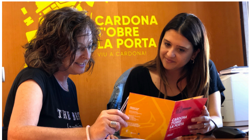
L'Oficina Local d'Habitatge està ubicada a la segona planta de l'ajuntament

Per això, el sistema contempla beneficis, tant pels propietaris com per als llogaters. Pel que