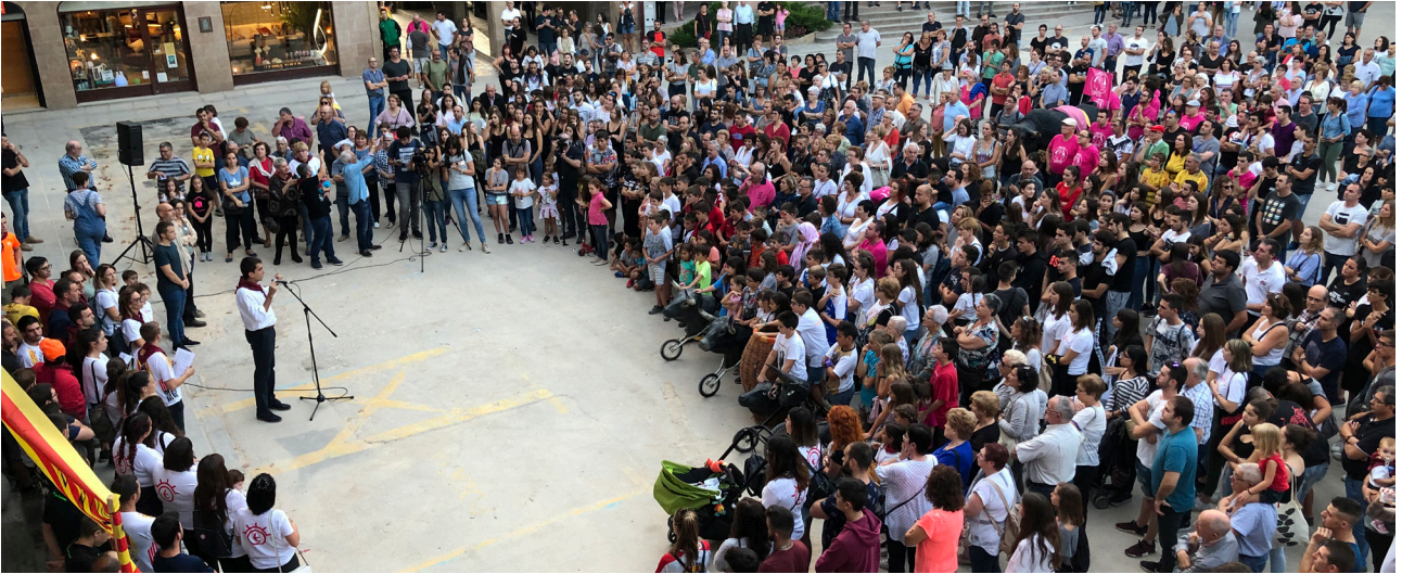
Uns 800 cardonins i cardonines es van concentrar a la plaça de la Fira el passat dissabte 28 de setembre

Pràcticament la totalitat de les entitats econòmiques, socials, culturals i esportives de Cardona han signat el manifest en defensa del Corre de bou. També ho han fet tots els partits amb representació al ple (ERC, PSC i Junts per Cardona), les penyes de bous, la Comissió de Bous i la Comissió de Festa Major.