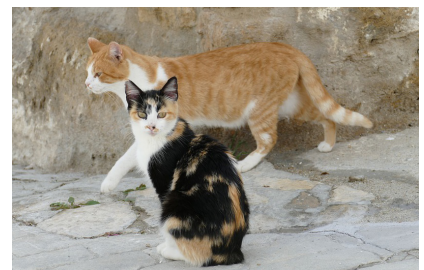
Un grup de voluntaris té cura de donar-los menjar

De les 14 colònies, quatre són a la Coromina (Balmes, Església, Av. Pau i Pla de la Salut), una és a la Creu Roja, dues són a la zona de les hortes (Paperer i pont