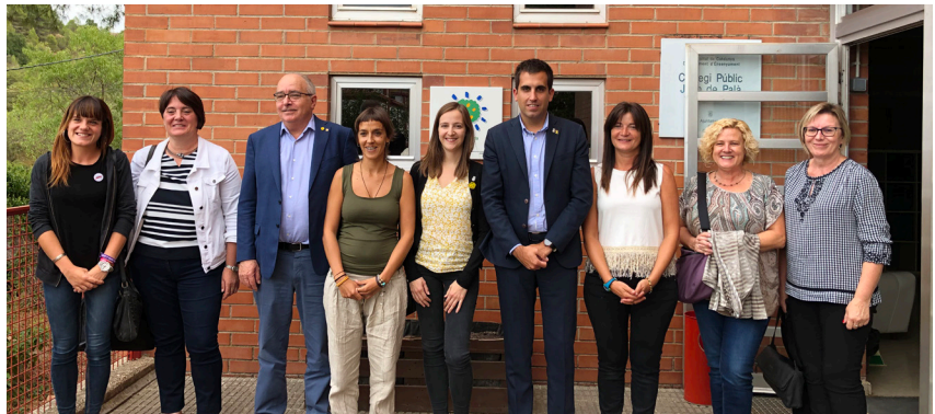
El conseller, l'alcalde, autoritats i l'equip directiu a l'escola Joan de Palà de la Coromina

En aquest mateix centre, també s'està instal·lant una caldera de biomassa que servirà per escalfar l'escola i també la Llar d'Infants Aliret. Es tracta d'una actuació que té un pressupost de 105.591,04 euros, que es finançarà amb una subvenció de Medi Ambient i una altra del Departament d'Educació.