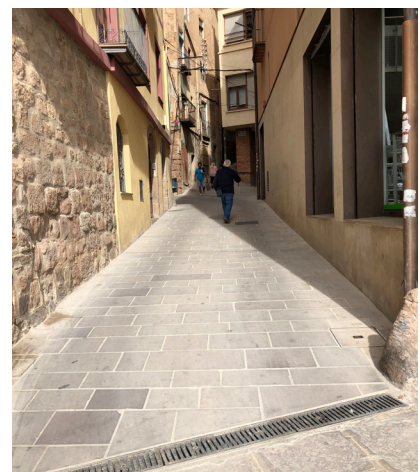
S'han suprimit voreres i s'ha renovat el paviment

L'obra ha rebut el finançament de la Diputació de Barcelona en el marc del Pla de Concertació 2015-2019.