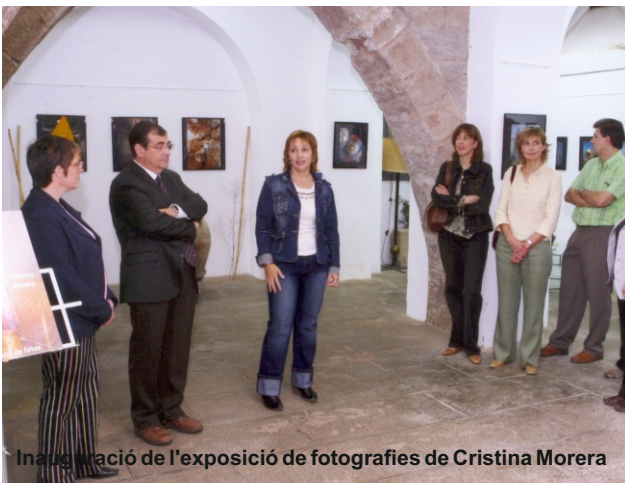
Inauguració de l'exposició de fotografies de Cristina Morera

Així mateix, la Fira va comptar amb l' exposició de fotos de la cardonina Cristina Morera , situada al vestíbul de l'Arxiu Històric. Va ser visitada per molta gent, que va quedar encantada de la qualitat i bellesa de les seves fotografies.