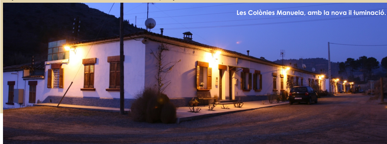
Les Colònies Manuela, amb la nova il·luminació.

El total del cost de la intervenció és de 15.690,54€, 7.845,27 finançats per l'Ajuntament i l'altre 50%, pel Departament de Medi Ambient i Habitatge.