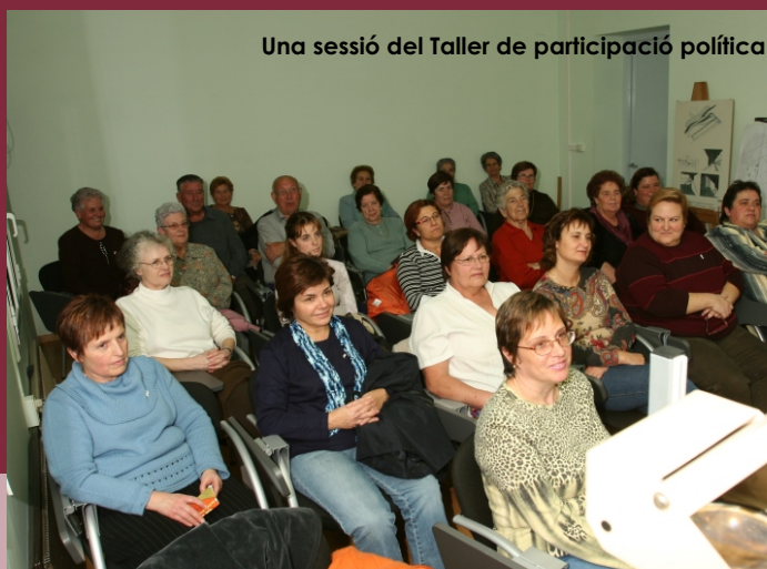
Una sessió del Taller de participació política

Després de portar a terme un Taller de participació política i social , destinat a treballar la participació de les dones en l'espai públic, s'ha portat a terme un cicle anomenat Espais de tertúlia , que també pretén afavorir la participació activa de les dones i impulsar l'intercanvi d'opinions i la discussió.