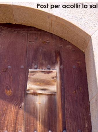
Post per acollir la sal