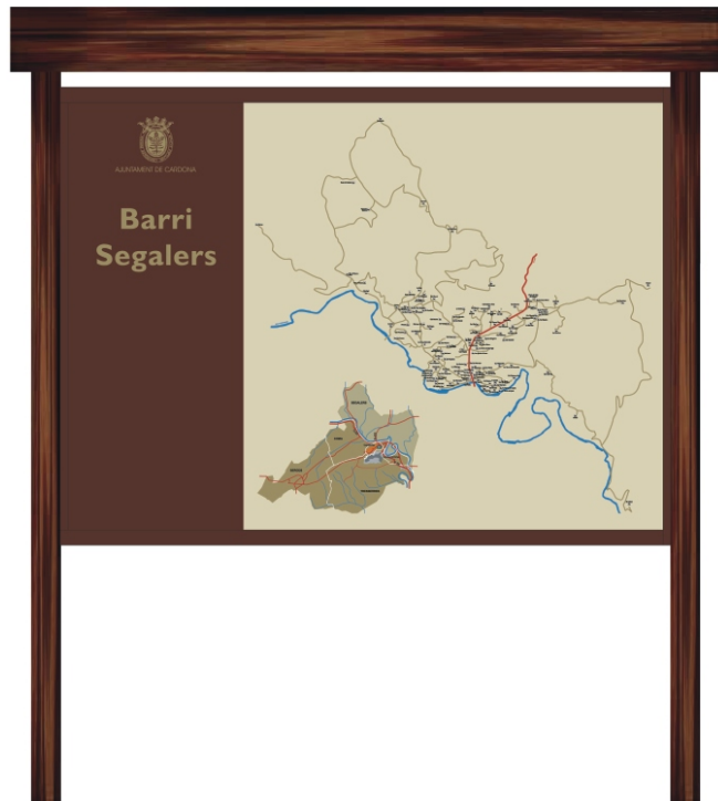
Mostra d'un dels plafons on apareixen senyalitzades les cases de pagès.

Més enllà de la senyalització, que ha estat un primer pas, es continua treballant en el manteniment dels camins i de les xarxes bàsiques. A causa de la multitud de camins existents al terme municipal de Cardona i al gran nombre de quilòmetres de pista forestal que hi ha, cal prioritzar les actuacions que es porten a terme. Ja s'ha finalitzat l'arranjament total del camí que connecta la carretera de Coma amb la carretera de la Mare de la Font, que estava molt malmès i en els treballs del qual han col·laborat els veïns.