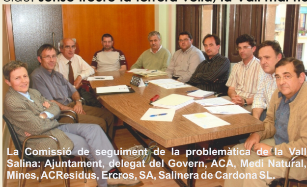
La Comissió de seguiment de la problemàtica de la Vall Salina: Ajuntament, delegat del Govern, ACA, Medi Natural, Mines, ACResidus, Ercros, SA, Salinera de Cardona SL.