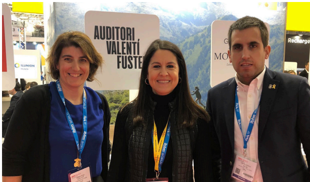
AQUEST NOVEMBRE S'HA PROMOCIAT CARDONA ALS PRINCIPALS ORGANITZADORS D'ESDEVENIMENTS DEL MÓN, DINS LA FIRA ITBM WORLD DE BARCELONA.