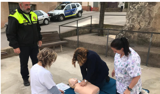
AMB MOTIU DEL DIA MUNDIAL DE CONSCIENCIACIÓ SOBRE L'ATURADA CARDÍACA ES VAN FER SIMULACIONS PER MOSTRAR EL FUNCIONAMENT DELS DEAS.