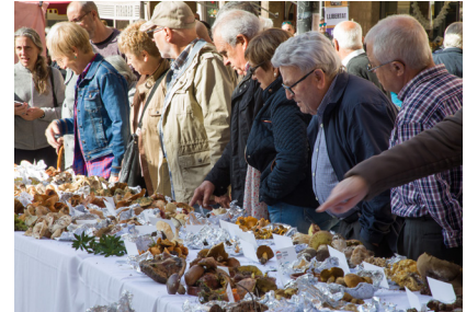
Parades amb gent mirant bolets

La XVII edició de la Fira de la Llenega va donar molt de protagonisme als restaurants i productors de la vila, que van oferir un complement gastronòmic als tradicionals concursos de bolets i a les exposicions micològiques que, com sempre, van caracteritzar el certamen. El bon temps va permetre que totes les activitats de la fira fossin molt concorregudes.