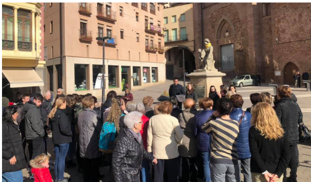
CARDONA ES VA SUMAR AL DIA INTERNACIONAL PER A L'ELIMINACIÓ DE LA VIOLÈNCIA ENVERS LES DONES, AMB DIVERSES ACCIONS I LA LECTURA D'UN MANIFEST.