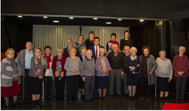
AQUEST NOVEMBRE S'HA HOMENATJAT ELS AVIS I ÀVIES QUE AQUEST 2019 FAN 90 ANYS. ENGUANY, HA COINCIDIT AMB ELS 40 ANYS DEL CASAL DE LA GENT GRAN.