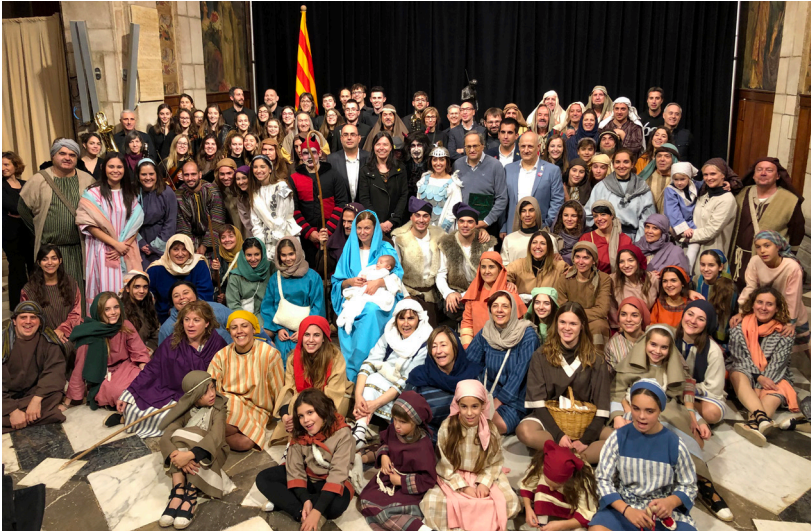
Fotografia final de grup, amb el president de la Generalitat, Quim Torra