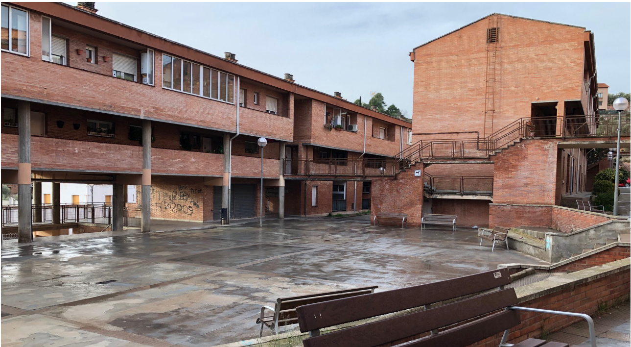
La millora de l'entorn de l'escola del Patrocini i dels 100 Pisos, la renovació de l'enllumenat i la renovació del sistema de climatització del teatre Els Catòlics són els tres projectes que l'Ajuntament de Cardona ha presentat