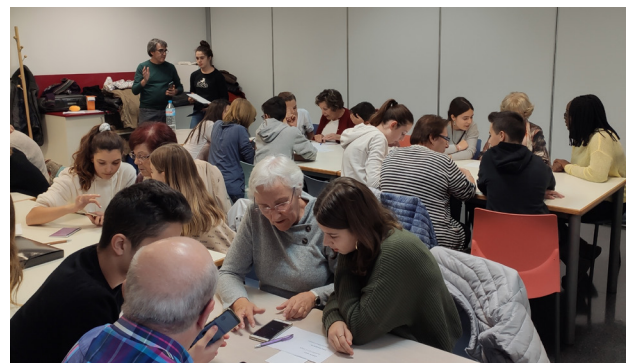
EN EL MARC DEL PROJECTE ICI ES VA REALITZAR LA SETMANA DE LES NOVES TECNOLOGIES I LES XARXES SOCIALS, AMB TALLERS PER A TOTES LES EDATS.