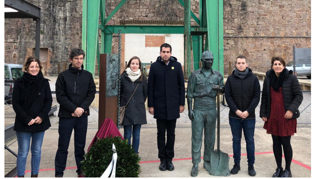
EL 4 DE DESEMBRE, AMB MOTIU DE LA FESTIVITAT DE SANTA BÀRBARA, PATRONA DELS MINERS, ES VA FER UN SENTIT HOMENATGE ALS MINERS I A LES SEVES FAMÍLIES.