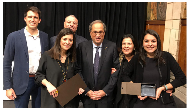
EL CENTRU HA REBUT AQUEST NOVEMBRE EL RECO-NEIXEMENT DE LA GENERALITAT ALS ESTABLIMENTS CENTENARIS PELS SEUS 103 ANYS DE COMERÇ AL POBLE.