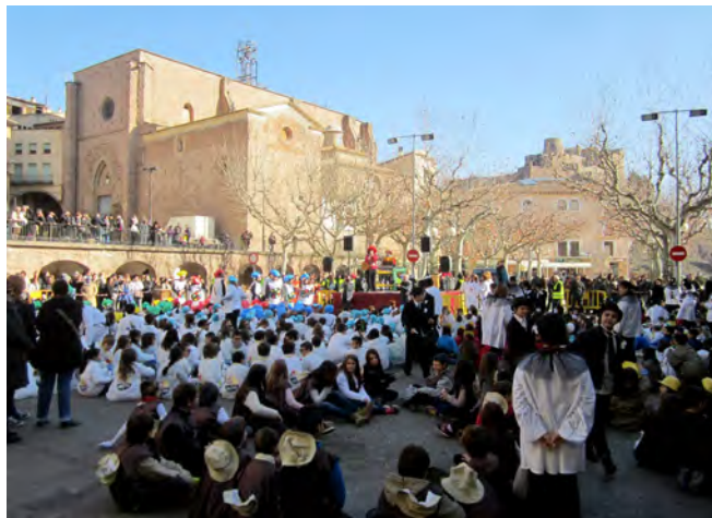
Els escolars de Cardona van omplir la plaça de la Fira per celebrar el Carnaval de les escoles