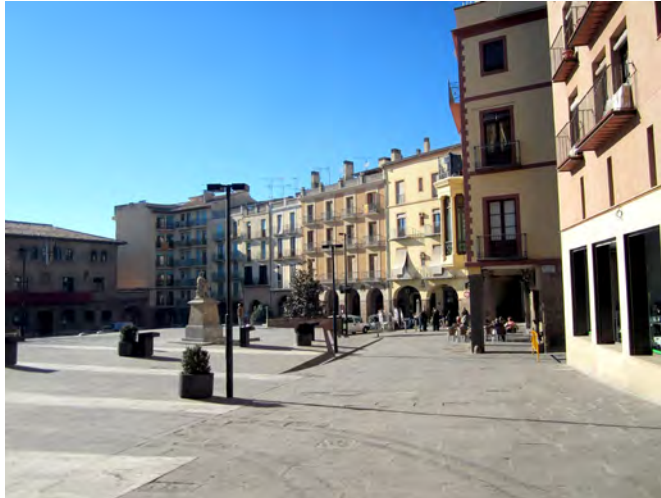
L'Ajuntament de Cardona vol promocionar les energies renovables

Les ordenances fiscals per a l'exercici 2016 es van aprovar amb els vots a favor d'ERC i l'abstenció de CiU i del PSC.