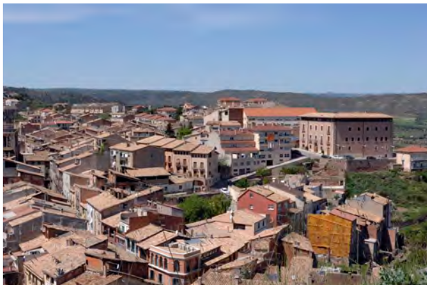
L'Ajuntament de Cardona vol promocionar les energies renovables

Per fer-ho, el consistori cardoní ha signat un conveni de col·laboració amb el Consell Comarcal del Bages que disposa d'una àrea específica destinada a la prestació de suport i assessorament als municipis en aquesta matèria. El Ple de l'Ajuntament de Cardona va aprovar, amb els vots favorables de l'equip de govern d'ERC i els grups de l'oposició,