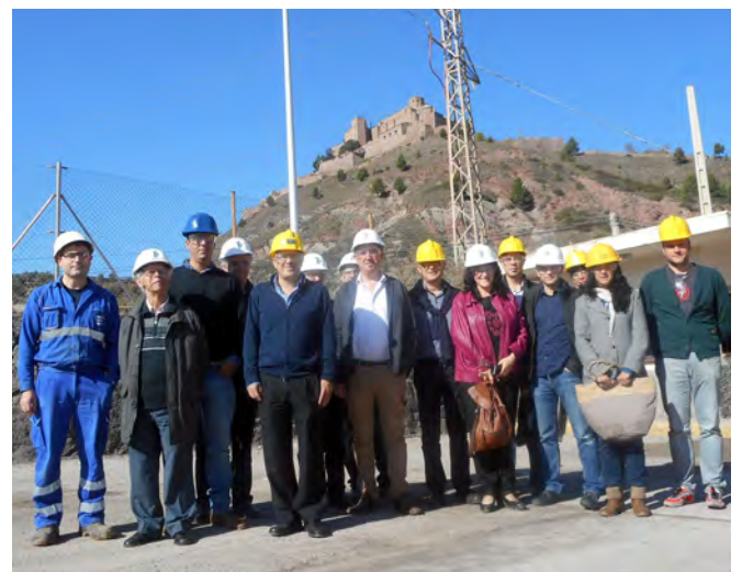
Empresaris del Solsonès i el Bages a les instal·lacions d'Ercros a Cardona

Diversos representants de les dues entitats van poder conèixer de primera mà el funcionament de la planta d'obtenció de sal comuna que l'empresa té a la vila cardonina. Durant la visita, que va comptar amb la col.laboració de l'Agència de Desenvolupament Local de Solsona i Cardona, els tècnics de la fàbrica van mostrar als visitants com funciona el procés d'extracció dels residus salins que contenen les terreres i la separació i neteja de la sal per poder ser utilitzada, després dels processos electrolítics, per altres fàbriques de l'empresa. A banda de conèixer el procés de restitució de les terreres, que redueix la salinitat de les aigües subterrànies, els responsables d'Ercros van explicar l'impacte econòmic que genera l'empresa a les comarques de la Catalunya Central.