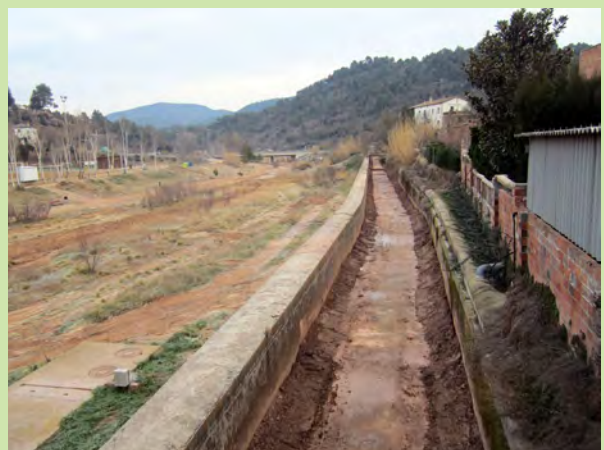
Aspecte del canal de la Coromina després dels treballs de neteja

La intervenció va comptar amb la conformitat de l'Agència Catalana de l'Aigua i s'emmarca en la voluntat de portar a terme tota l'adequació i millora de la llera del riu Cardener al seu pas pel nucli urbà de la Coromina.