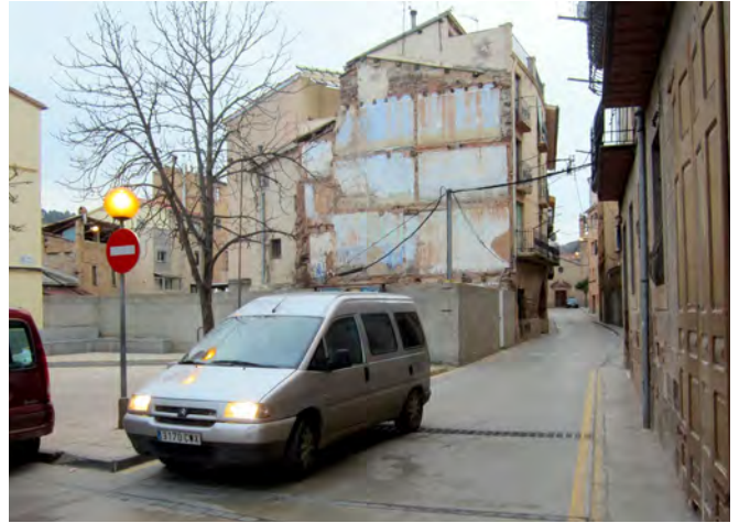
Imatge del carrer Església de la Coromina

La reordenació del trànsit sorgeix de les reunions de treball que l'Ajuntament manté periòdicament amb l'Associació de Veïns de la Coromina, la qual va fer arribar aquesta necessitat. La nova senyalització ha estat validada per la Policia Local de Cardona.