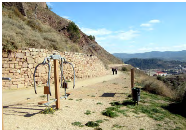
Inici del camí Nou

A més de facilitar la informació dels itineraris i la descripció