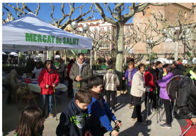
El Mercat de Salut al passeig de la Fira

El Mercat de Salut és una iniciativa que ofereix a empreses i productors locals la possibilitat de donar a conèixer el seus productes aprofitant la celebració del mercat dominical. Cada últim diumenge de mes una empresa local podrà disposar d'una parada gratuïta per mostrar la seva oferta amb els únics requisits que siguin iniciatives de proximitat i que els productes o serveis que s'hi promocionin estiguin relacionats amb els hàbits de vida saludables. El seu objec-