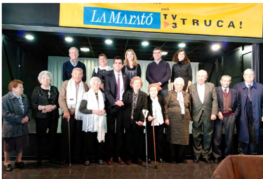
Imatge de grup dels avis i àvies homenatjats i els responsables municipals