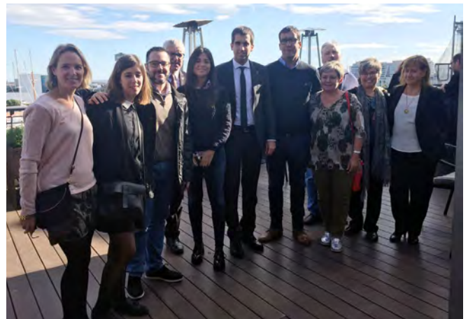
Imatge dels participants al projecte Sabors de 1714 a Barcelona

El diumenge 4 d'octubre es van presentar a la plaça de la Fira de Cardona els nous plats del projecte Sabors del 1714 que s'oferiran durant la temporada de tardor-hivern 2015-2016.