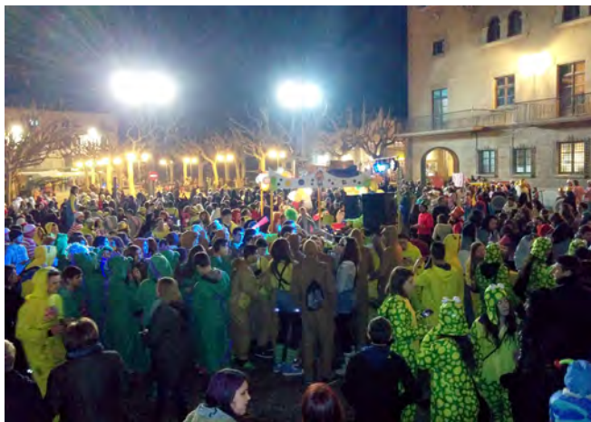
La Baixada d'Andròmines va congrega un públic nombrós

Colla de Geganters i Grallers de Cardona. Divendres es va celebrar el Carnaval de les escoles, amb la rua de carnaval, el sermó i l'animació infantil amb el grup 'Ai Carai'.