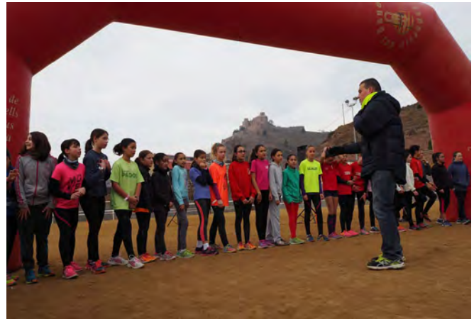
Els participants just abans de la sortida de la cursa

El Cros Escolar de Cardona és puntuable per a la fase comarcal de cros dels Jocs esportius escolars de Catalunya i s'emmarca dins les activitats de la Jornada del Cor que im-