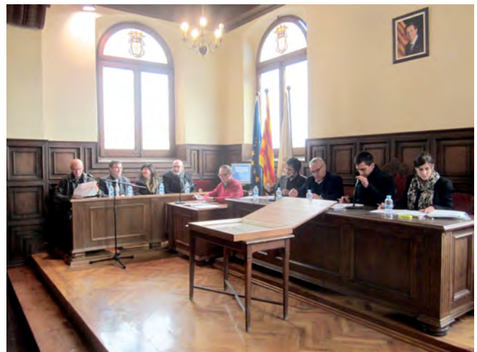
Imatge de recurs del Ple de l'Ajuntament de Cardona

Es destina una partida de 313.000 euros a inversions que inclou l'inici de les obres del centre de convencions a l'antic Cine Moderno.