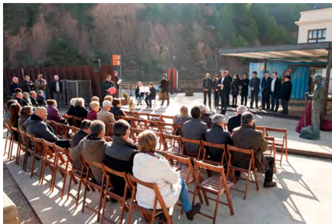
Imatge de l'acte institucional de la festivitat de Santa Bàrbara en homenatge als miners de Cardona i a les seves famílies