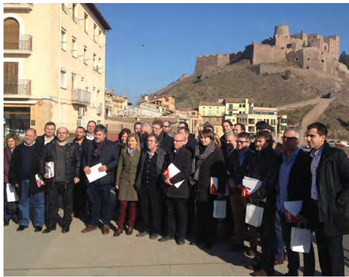
Imatge dels alcaldes de l'AMI presents a Cardona

Una trentena d'alcaldes catalans van ser presents a la sessió que, entre d'altres qüestions, va debatre sobre l'elecció del nou president de l'associació, després que el