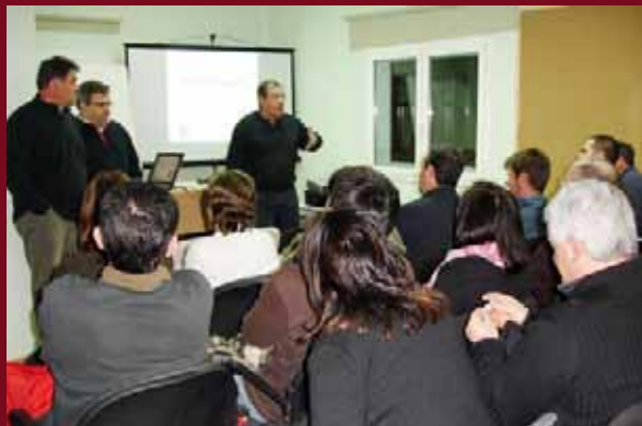
El curs de benestar animal va ser seguit per una cinquantena d'inscrits

El contingut del curs se centrava a explicar i avaluar el coneixement de les tècniques de benestar animal per a titulars i personal d'explotacions porcines i bovines, així com per a transportistes d'animals.