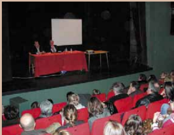
El teatre Els Catòlics es va omplir totalment per seguir la xerrada del Dr. Valentí Fuster

En la seva intervenció, Fuster va insistir especialment en la importància de promoure un estil de vida saludable, sobretot des de joves, que contribueixi a millorar la salut cardiovascular de les persones.