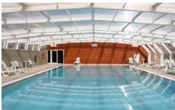
Imatge de la piscina coberta del Vilar Rural de Cardona

La posada en marxa d'aquest servei és fruit del conveni de col.laboració signat entre el consistori i el grup Serhs –propietari del Vilar Rural de Cardona- que ha permès a l'Ajuntament disposar de les instal.lacions de la piscina coberta del complex hotelier. Tal i com fixava el conveni, el servei es va interrompre el mes de juny, coincidint amb la temporada d'estiu i la posada en marxa de les piscines municipals de Cardona. Tanmateix les dues parts han avançat la seva voluntat de reobrir la piscina coberta la propera tardor.