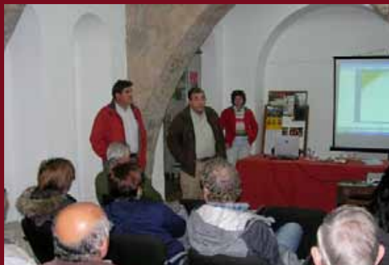
La xerrada va reunir una trentena d'assistents

Amb aquesta iniciativa el consistori va voler apropar al sector agrari del municipi algunes de les noves oportunitats de desenvolupament econòmic i productives que en l'actualitat es desenvolupen en el sector primari.