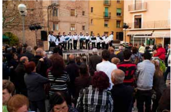
Havaneres amb Salabró de Mar