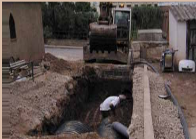
Imatge de les obres dutes a terme a la Coromina

Ara l'Ajuntament ha tornat a insistir en la necessitat que l'ACA aportí finançament per a l'execució total d'aquest projecte