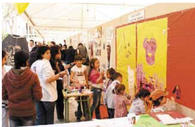
L'Associació de Veïns del Barri Mercat va muntar un taller infantil de pintura