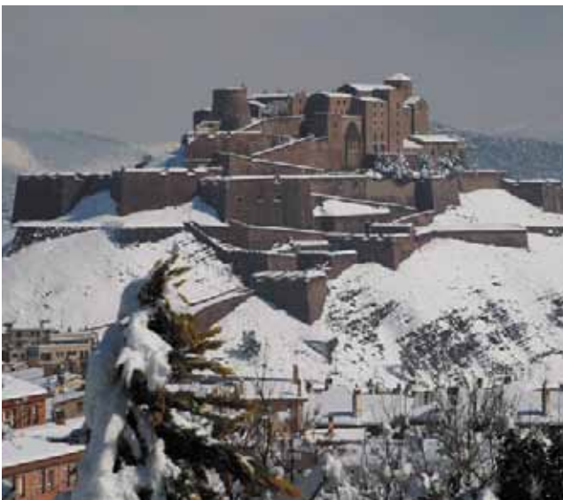
La intensa nevada va deixar boniques imatges de la vila de Cardona

Les tasques van centrar-se, sobretot, en la retirada la neu de la via pública i el manteniment dels accessos a equipaments i edificis de serveis. El dispositiu va doblar horaris i efectius des del primer moment, de cara a paliar els efectes de la gran nevada. En els dies successius a la tempesta es van llançar més de 15.000 quilos de sal. Així mateix, l'Ajuntament va agrair als veïns la seva col.laboració per reduir els efectes negatius de la nevada