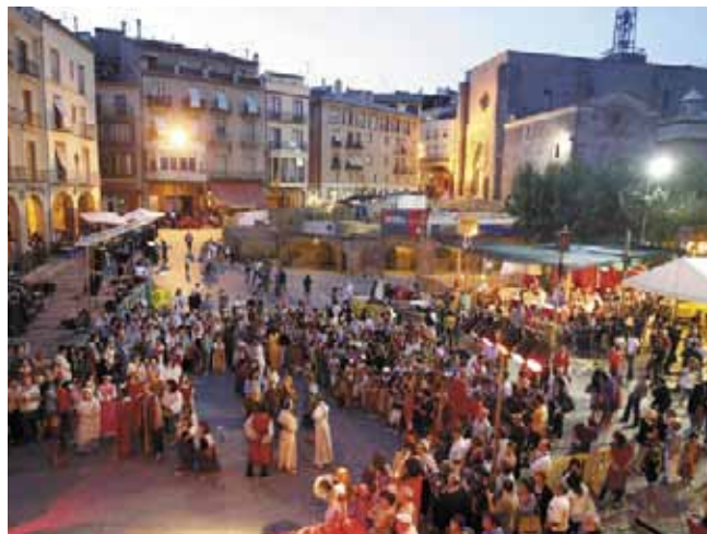
La plaça de la Fira es va omplir de gent i activitats