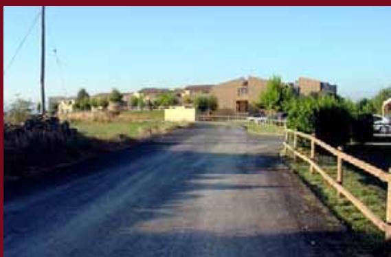
Accés asfaltat al camí del Vilar Rural

El Vilar Rural de Cardona ha asfaltat el tram de camí que va de la carretera del Miracle fins al complex turístic, una actuació que permetrà millorar l'accés a un dels establiments turístics més coneguts del municipi. Les obres han permès adequar un tram d'uns 500 metres de camí on, a més de col·locar una capa d'asfalt, s'han netejat els vorals i s'ha construït una cuneta a la part inicial del camí.