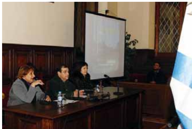
La Cònsol adjunta de la República Oriental de l'Uruguai a Barcelona va ser present a la recepció