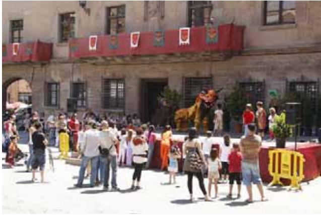
La Fira va programar diversos espectacles infantils