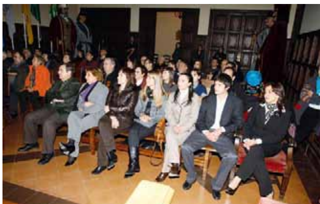
L'acte oficial de benvinguda va omplir el saló de sessions de l'Ajuntament