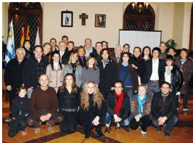
Foto de grup de l'Ajuntament, els pioners de l'agermanament, els joves de l'Uruguai, les famílies acollidores i la Cònsol general adjunta de l'Uruguai

En l'acte oficial de benvinguda de la delegació uruguaiana, celebrat el passat 5 de febrer al saló de sessions de l'Ajuntament, hi va assistir la cònsol adjunta de l'Uruguai a Barcelona. Aixímateix, l'Ajuntament va