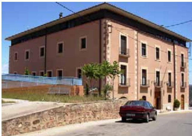
La Residència Sant Jaume augmenta les seves fonts de finançament

D'aquesta manera, la residència Sant Jaume disposa de la solvència econòmica necessària per mantenir el servei durant els propers anys i amplia fins a 40 el nombre