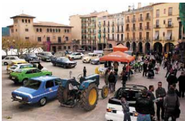
Els Amics del Motor de Cardona van omplir la Fira de vehicles clàssics