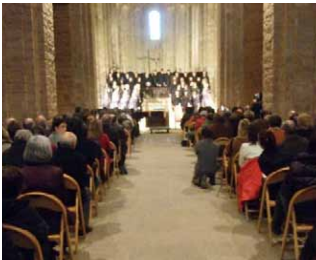
La col·legiata plena en un dels concerts del Cicle de Música Sacra