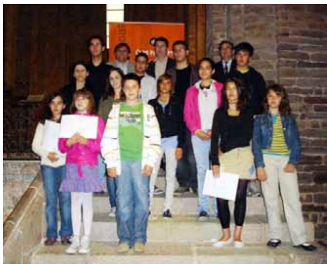
Fotografia de grup amb els alumnes premiats