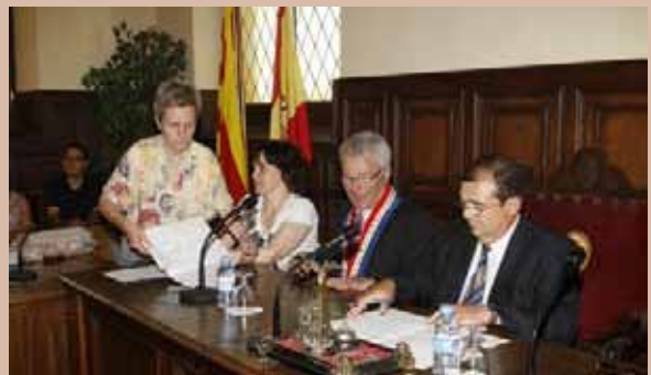
Els alcaldes de Cardona i Mazères signant el Protocol d'Agermanament

Amb la signatura del protocol les dues poblacions reforcen uns llaços d'amistat que es remunten al segle XIII quan el fundador de Mazères, Roger IV, es va casar amb Brunisenda, filla del comte de Cardona Ramon IV Folc.