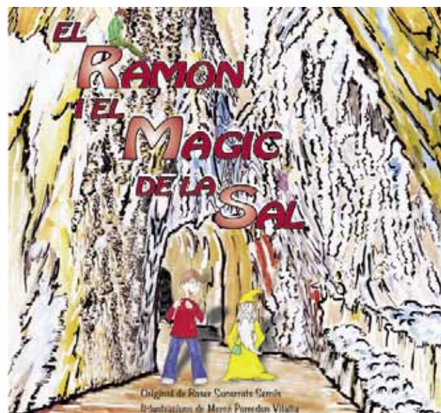
Portada del llibre "El Ramon i el màgic de la sal"