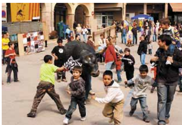
El Corre de bou infantil de la Penya Pagesos-El Calaixó va tenir molt èxit

La intenció dels responsables municipals és la de continuar celebrant la mostra sempre que les entitats de Cardona ho desitgin.