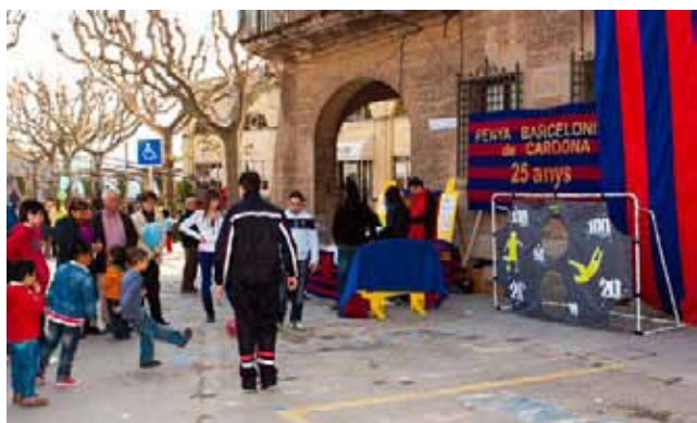
Jocs de futbol amb la Penya Barcelonista de Cardona