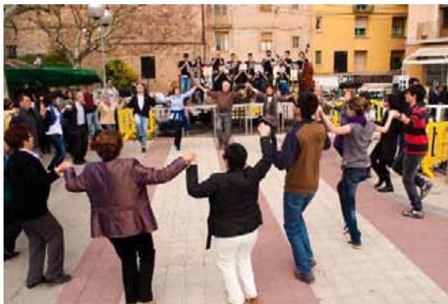
La Cobla de Cardona va oferir un concert de sardanes

A la tarda van continuar les activitats amb tallers infantils, un concert de combos musicals, havaneres, orquestres, espectacles musicals o la projecció de "Les Aventures Extraordinàries d'en Massagran". A més, al llarg de tot el dia hi va haver una mostra de vehicles clàssics, i la instal·lació d'un hospital de campanya a la Fira de dalt. Les actuacions del grup Vas-Tukada i el Corre de foc de les Bruixes de Cardona van posar el punt i final a la segona edició de la Fira d'Entitats de Cardona.