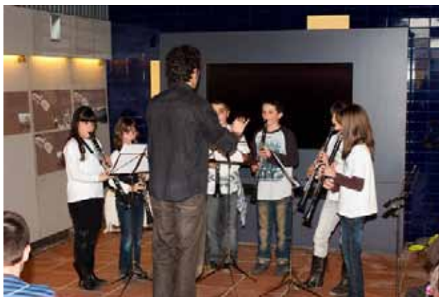
Els alumnes de Musicant van oferir diverses audicions musicals