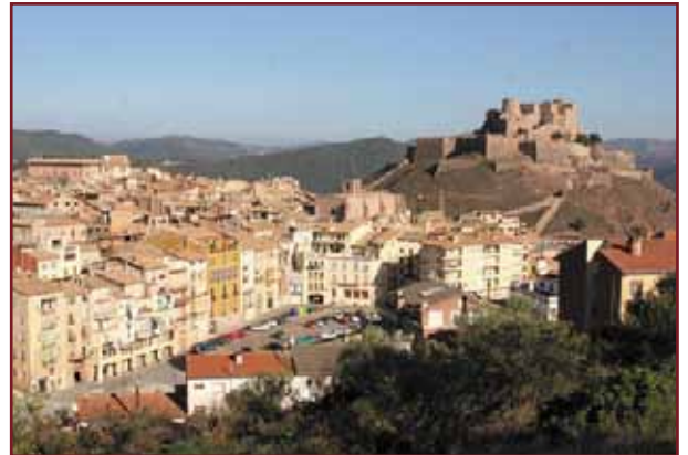
Cardona disposarà d'un nou planejament urbanístic

El POUM de Cardona preveu a grans trets augmentar el sòl residencial i d'equipaments, potenciar l'activitat industrial i posar en valor els recursos patrimonials de la vila. El desenvolupament del POUM proposa omplir la trama urbana i consolidar el creixement urbanístic al voltant de les zones ja urbanitzades. A més, es reserven els terrenys de l'antiga llera del Cardener fins a La Plantada a equipaments esportius com el nou camp de futbol. Amb el canvi d'ubicació d'aquest equipament s'aprofitarà per connectar els nuclis de Cardona i la Coromina a través d'un passeig de vianants