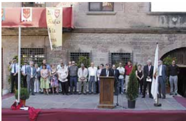
Les autoritats durant la cerimònia dels Síndics de la Terra