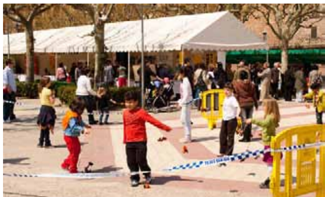
Taller de jocs malabars a càrrec de les Bruixes de Cardona