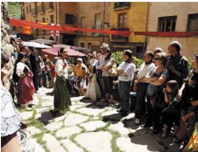
Les visites teatralitzades pel centre històric van ser un èxit de públic