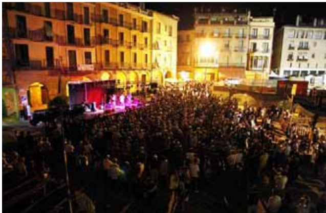
La Trinca del segle XXI també va ser present a la Fira