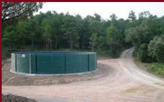
El dipòsit permetrà millorar la lluita contra els focs

L'any passat l'Ajuntament ja va construir un dipòsit antiincendis de la mateixa capacitat a la finca de Capdebocs.