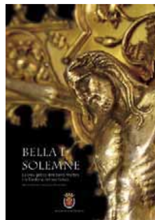
Portada del llibre "Bella i Solemne. La creu gòtica dels Sants Màrtirs i la Cardona del seu temps".