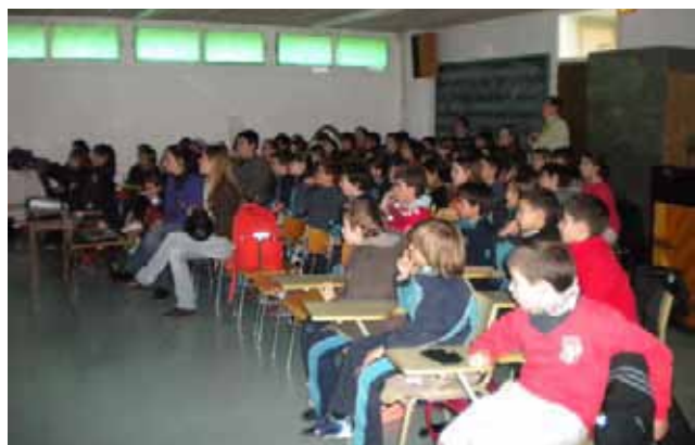
El col·legi del Patrocini, origen de la relació entre les dues Cardona, durant la visita dels joves de l'Uruguai