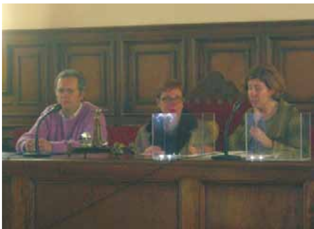
El sorteig es va fer en un acte públic al saló de sessions de l'Ajuntament

El procés de lliurament es va fer per sorteig. D'entre les 13 sol·licituds que s'havien presentat per poder accedir a la cessió dels pisos, els tècnics del Departament en van admetre 4 atès que les altres 9 restants no complien els requisits o no van presentar la documentació requerida en la convocatòria.