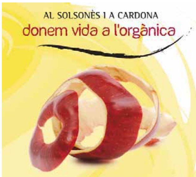
Imatge de la campanya per a la recollida de la fracció orgànica

Sota l'eslògan "Al Solsonès i a Cardona donem vida a l'orgànica" s'han realitzat diverses sessions informatives per explicar a la ciutadania el funcionament del nou servei. La campanya d'informació feta a Cardona durant els mesos de maig i de juny ha permès informar el 82% de les famílies cardonines i repartir fins a 1.293 kits de reciclatge.