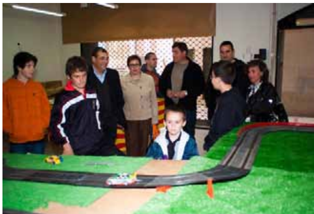
Els Amics del Motor de Cardona van muntar dos circuits de Scalextric