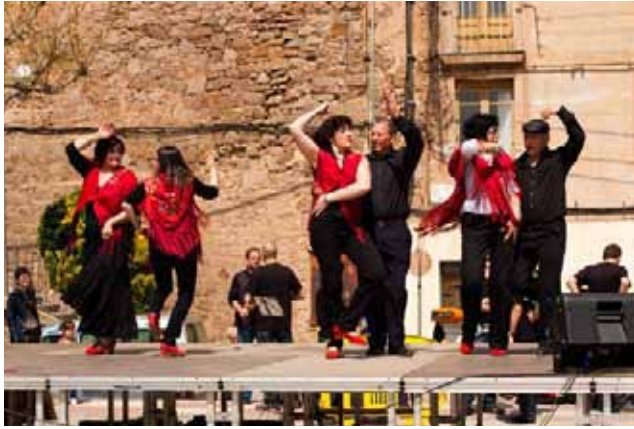
Mostra de sevillanes amb les membres de la Casa de Andalusia