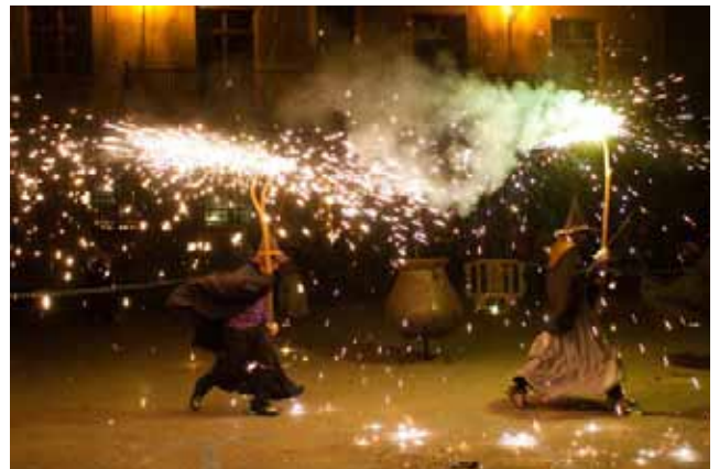
Les Bruixes de Cardona van cloure la Fira amb un espectacular correfoc