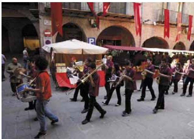
La Banda de Cardona va acompanyar les autoritats