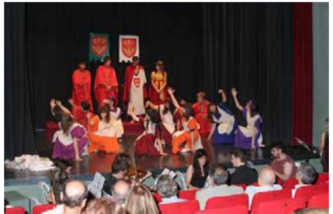
Representació del Dret d'Aimines pels alumnes de l'IES Sant Ramon