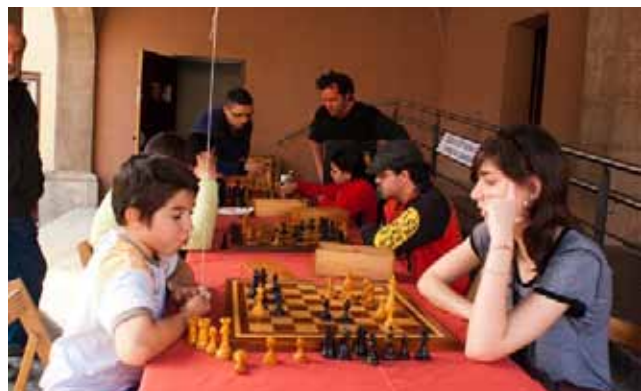
El Foment Cardoni va organitzar una exhibició d'escacs