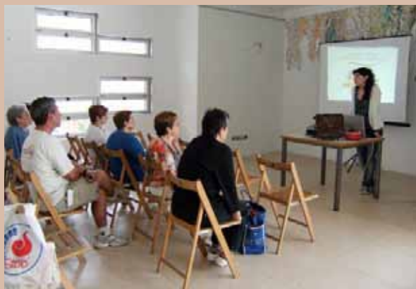
Les sessions informatives van registrar un seguiment molt nombrós

A la pàgina web: www.donemvidaalorganica.cat