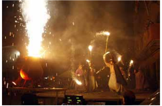
Les Bruixes de Cardona durant el seu espectacle de foc