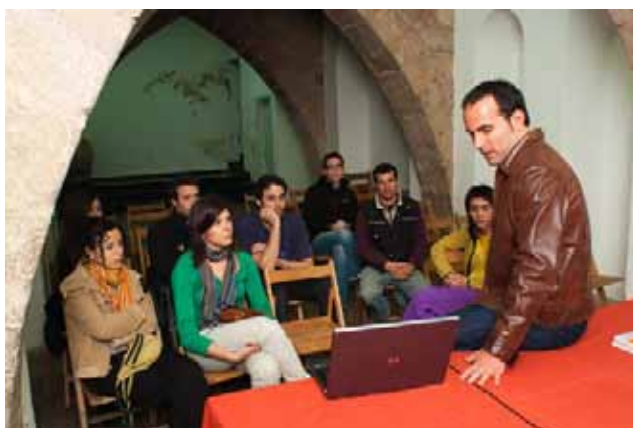
Xerrada sobre urbanisme i paisatge organitzada per l'Associació Cultural 18 de setembre