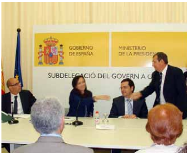
L'alcalde de Cardona amb la ministra de Vivenda, Beatriz Corredor

Els allotjaments, d'uns 30 metres quadrats de superfície aproximadament, estaran formats per l'apartament independent que inclou un espai principal que farà les funcions de sala d'estar i menjador, una petita cuina, un bany i una habitació. A més, l'edifici disposarà d'un seguit de serveis comuns: ascensor, bugaderia, trasters i un ampli espai multiusos pensat bàsicament com a