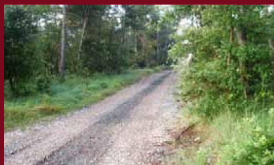
Protecció Civil de Cardona va col·laborar en la neteja de camins