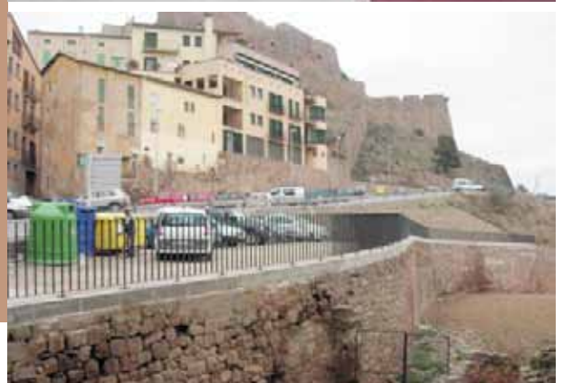
L'Ajuntament ha refet la barana de davant del pavelló i s'ha instal·lat un parc infantil al carrer de la Munició