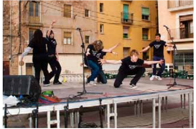
Actuació d'El Traspunt