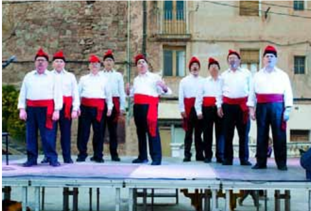
Actuació de La Faràndula