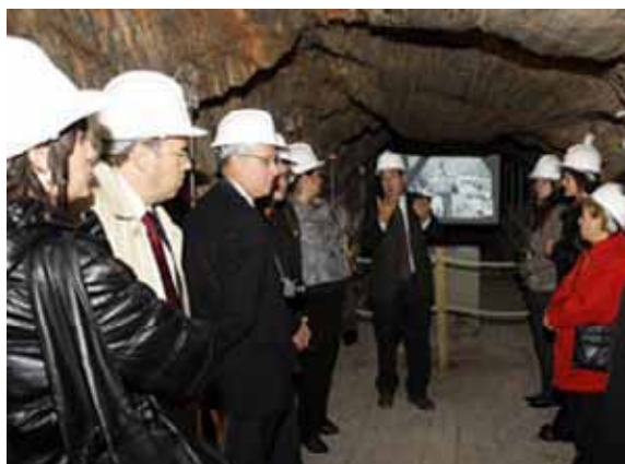
Imatge de la presentació del nou audiovisual a l'interior de la mina

"La Sal de la Història", que ha estat realitzat per