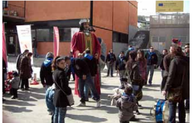
La Marató de Donació de Sang va aplegar un gran nombre de cardonins

Els organitzadors van destacar el suport i la solidaritat de la gent de Cardona i la importància de celebrar aquests tipus de jornades per tal de sensibilitzar la població sobre la necessitat de donar sang de manera habitual, captar nous i noves donants i aconseguir el major nombre de donacions possible.