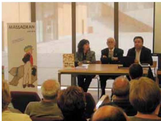
Una imatge de la xerrada a la Biblioteca municipal

Per altra banda, el 24 de maig la Biblioteca Municipal Marc de Cardona va dedicar l'Hora del