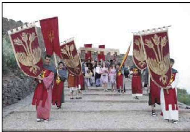
Espectacular sortida del Senyor i la Minyona des del castell